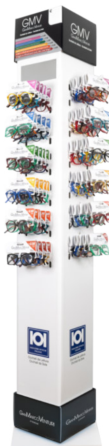
ESPOSITORE DA TERRA GIREVOLE DA 72 A 120 OCCHIALI (VUOTO) FROM 72 TO 120 GLASSES ROTATING FLOOR DISPLAY (EMPTY) (SKU: ESPOGMV48) (b) 182 x 22 x (h) 23,5 cm