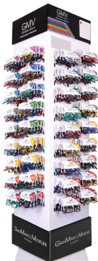
ESPOSITORE DA TERRA GIREVOLE DA 216 A 360 OCCHIALI (VUOTO) FROM 216 TO 360 GLASSES ROTATING FLOOR DISPLAY (EMPTY) (SKU: ESPOGMV144) (b) 182 x 40 x (h) 41 cm