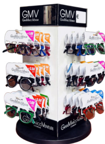
ESPOSITORE DA BANCO GIREVOLE DA 48 A 60 OCCHIALI (VUOTO) FROM 48 TO 60 GLASSES ROTATING FLOOR DISPLAY (EMPTY) (SKU:1224) (b) 62 x 16 x (h) 16 cm