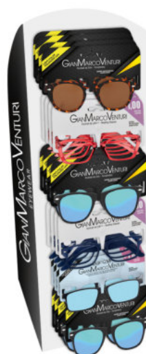
ESPOSITORE DA BANCO GIREVOLE DA 16 A 32 OCCHIALI (VUOTO) FROM 16 TO 32 GLASSES ROTATING FLOOR DISPLAY (EMPTY) (SKU: 1243) (b) 55 x 22 x (h) 17,5 cm